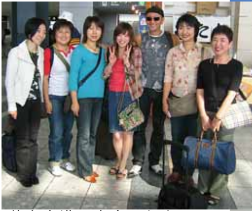
仙台空港で出会った人