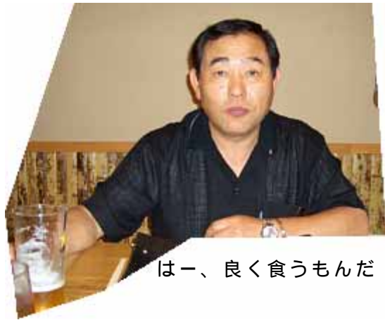
は一、良く食うもんだ