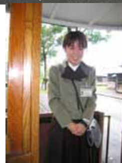
糸つむぎのおばさん