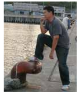
いや、ホリエモン似です