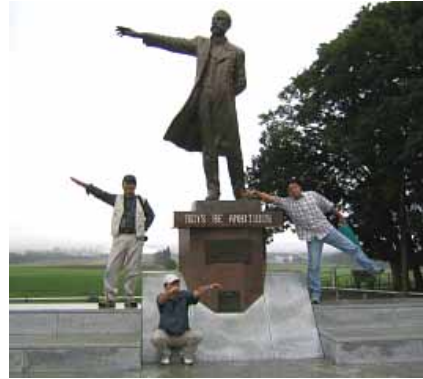
少年よ、バカオヤジにはなるな